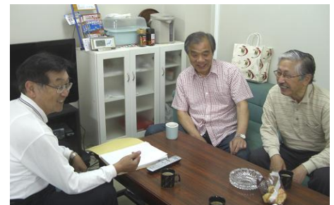
(事務所での対談風景)

6年前に町内会長の順番が回ってきたので引き受けましたが、それからずっと町内会の役員を続けています。今は大野連合町内会会長と洲本連合の副会長をしています。大野地区で開始した菜の花の栽培、菜種油の斡旋など、「菜の花エコプロジェクト」を洲本全体に積極的に推進しています。