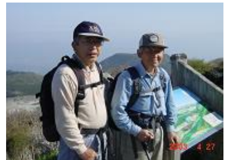
(青海さんと屋久島へ)

中国に赴任したのは、電池工場を建設する時期でしたが、合弁相手との交渉に中国当局が関与しており一度決めたことが簡単に変更されるので苦労しました。