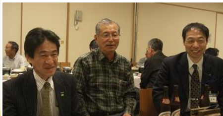
(ご来賓の和田部長、大東委員長)